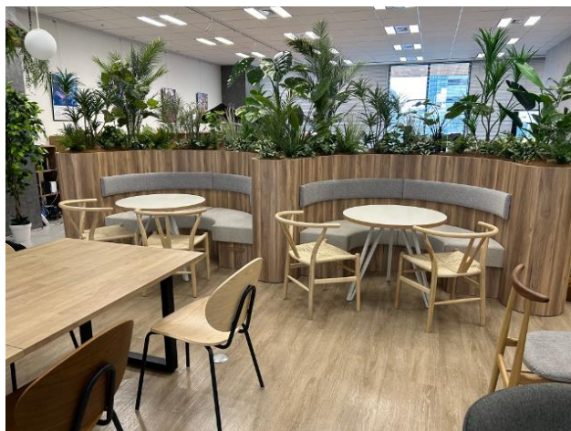
円形休憩ソファ+プラントボックス