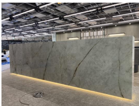
ブックシェルフ エントランス正面に設置 表面は海外製の大理石タイル貼り