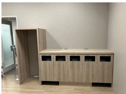
くず入れと冷蔵庫カバーを組み合わせた 什器

所在地…東京都千代田区 受注内容…特注造作家具 納入年月…2024年1月 担当…水野