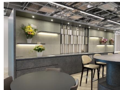
カフェバックカウンター 様々な機能を取り入れた 中央のルーバーはデザイン上のアクセント

W6500*D1730*H2554の巨大カウンター 裏側は冷蔵庫やくず入れを組み込み キッチンカウンターの様相